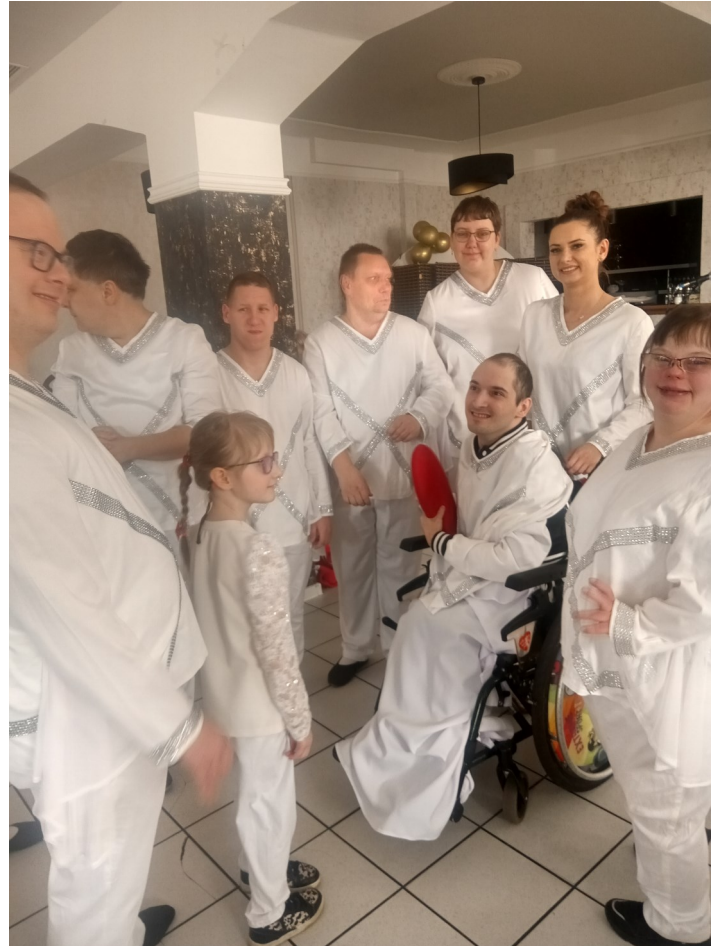
Podopieczni świetlicy „Radość Życia” przedstawiają swój program.