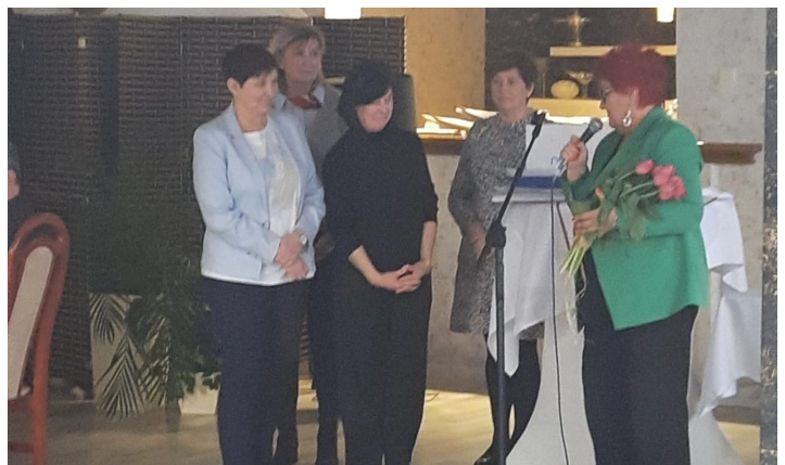
Prezes Okręgu Śląskiego dziękuje wodzisławskim związkowcom za wieloletnią i bardzo skuteczną pracę.