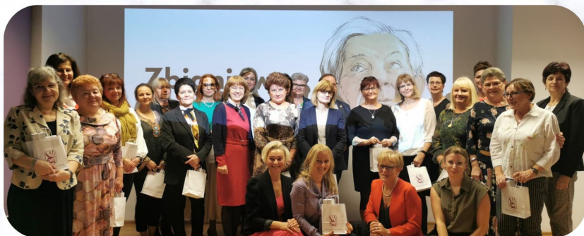
Członkowie Zarządu Oddziału ZNP w Siemianowicach Śląskich

Współpracuje z władzami naszego miasta, mając na uwadze dobro szkoły, uczniów i jej pracowników. Dbą również o rozrywkę i wypoczynek swoich członków, dlatego też organizuje wiele ciekawych imprez, spotkań i wycieczek, które zapisały się na kartach historii naszego Oddziału.