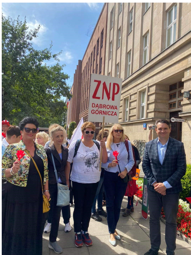
Władze związkowe i miejskie Dąbrowy Górniczej na wspólnej pikiecie w Warszawie.